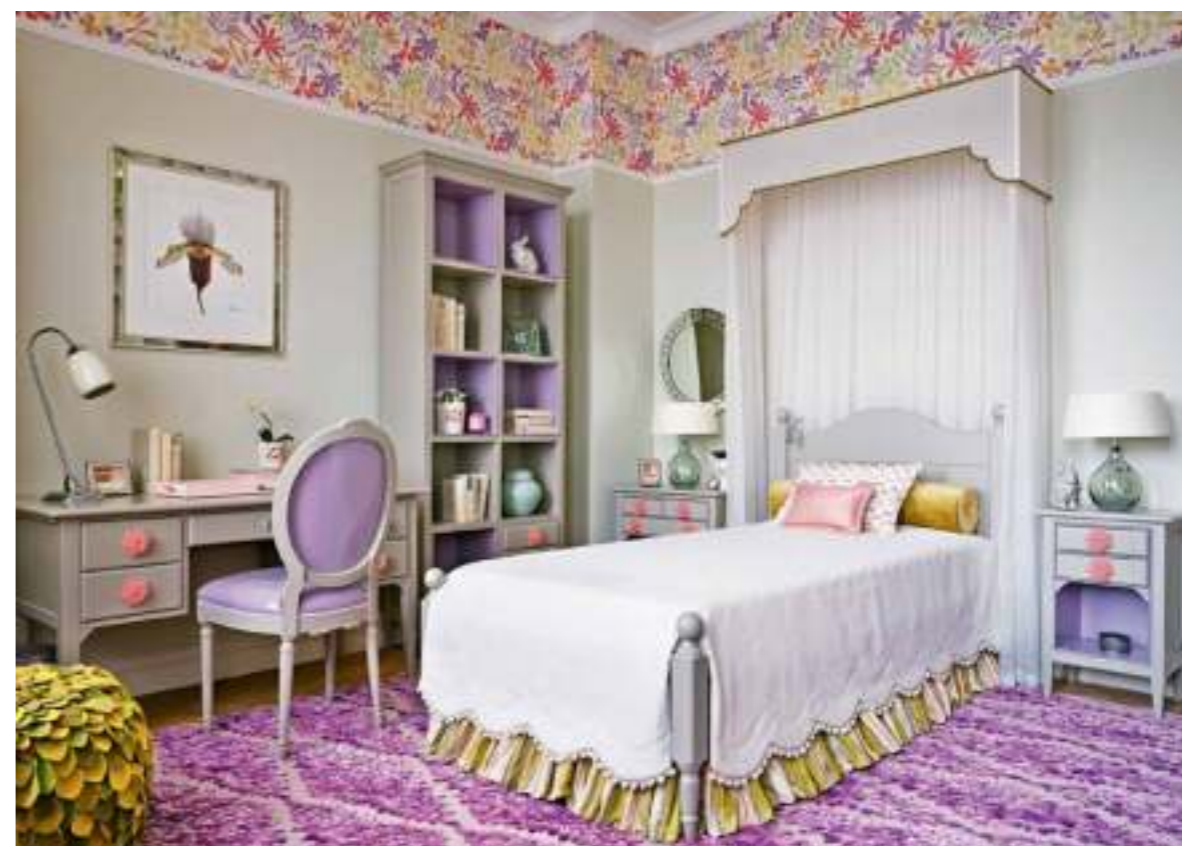
В оформлении детской и хозяйской спален использован тот же приём, что и в столовой. Пространство под потолком декорировано широким карнизом из обоев, но уже с ярким цветочным рисунком. В родительской спальне жемчужно-серый цвет стен оттенён алым, а в детской настроение задают салатный и лиловый. Изголовья кроватей в обеих спальнях венчают лаконичные балдахины. Мебель для детской, HALLEY ITALY. Кровать в спальне, VISPRING. Кресло, SWAIM. Столик, CENTURY FURNITURE. Зеркало, YEARN GLASS.