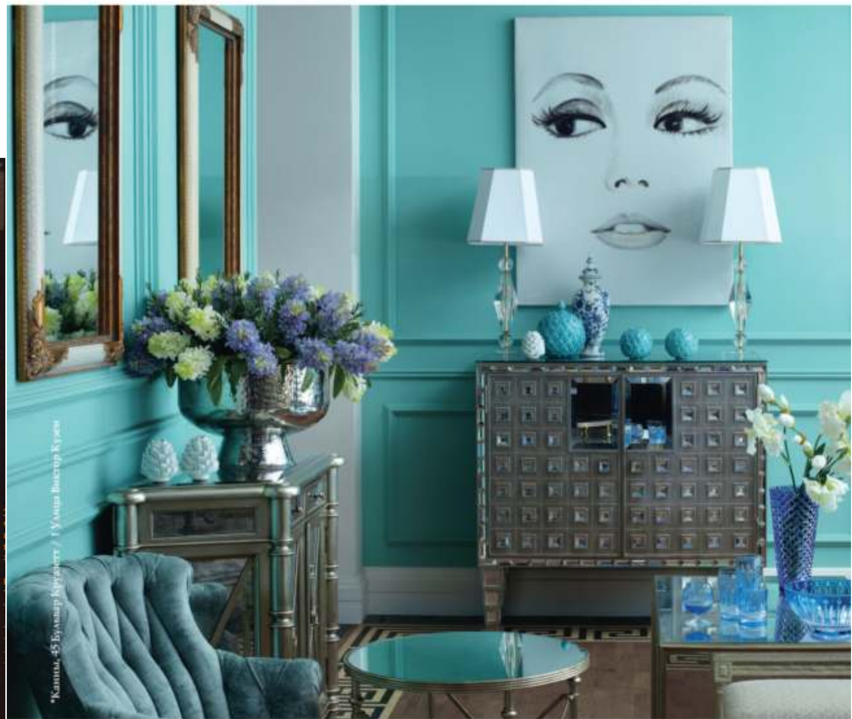
*Канны, 45 Бульвар Круазетт / 1 Улица Виктор Кузен